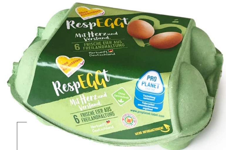
Beispiel „6 frische respeggt-Eier aus Freilandhaltung“