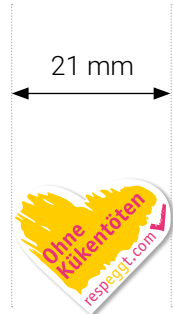
Mindestgröße: 21 mm Breite