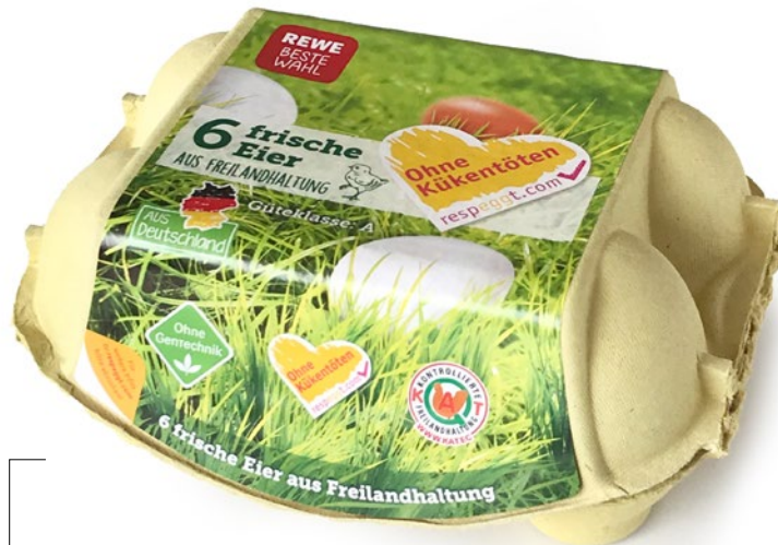
Beispiel „6 frische Eier aus Freilandhaltung REWE Beste Wahl“